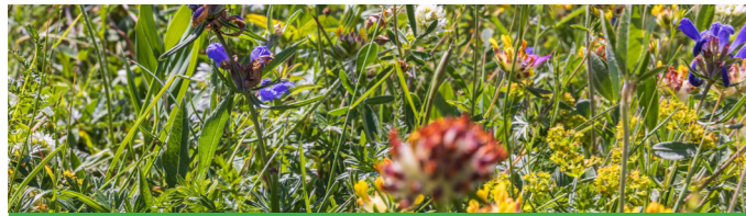
Blumenwiese mager 840