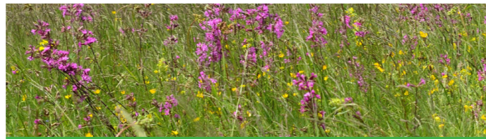
Blumenwiese feucht 820