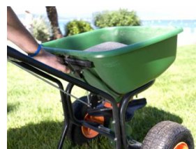
Leichte Ausbringung des Granulates mit Hilfe eines herkömmlichen Streuers