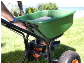
Leichte Ausbringung des Granulates mit Hilfe eines herkömmlichen Streuers